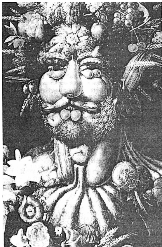
Рис. 2. Картина кисти Джузеппе Арчимбольдо: лицо... или фрукты и овощи.

изображено человеческое лицо. Однако при более внимательном рассмотрении картины становится понятным, что элементами этой картины являются овощи и фрукты. Я считаю, что этот пример не убедительный, так как он основывается уже на наших субъективных ощущениях, но могу привести довольно много примеров из уже классической нейрофизиологии, которые подтверждают это высказывание [20], но все это остается в рамках нейрофизиологии и не переходит в субъективные ощущения.